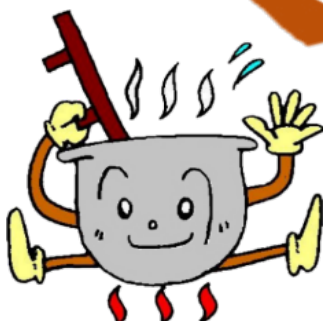
富山市子どもの村イメージキャラクター ごえもんちゃん

スポ協 HP https://www.taikyou-toyama.or.jp/ 子どもの村 HP https://www.knei.jp/~child/v/