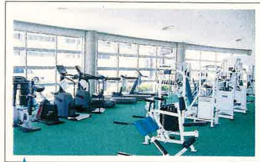
▶ トレーニングルーム

体全体をバランス良く鍛えるトレーニング機器がいっぱい。体づくり、健康づくりにご活用ください。