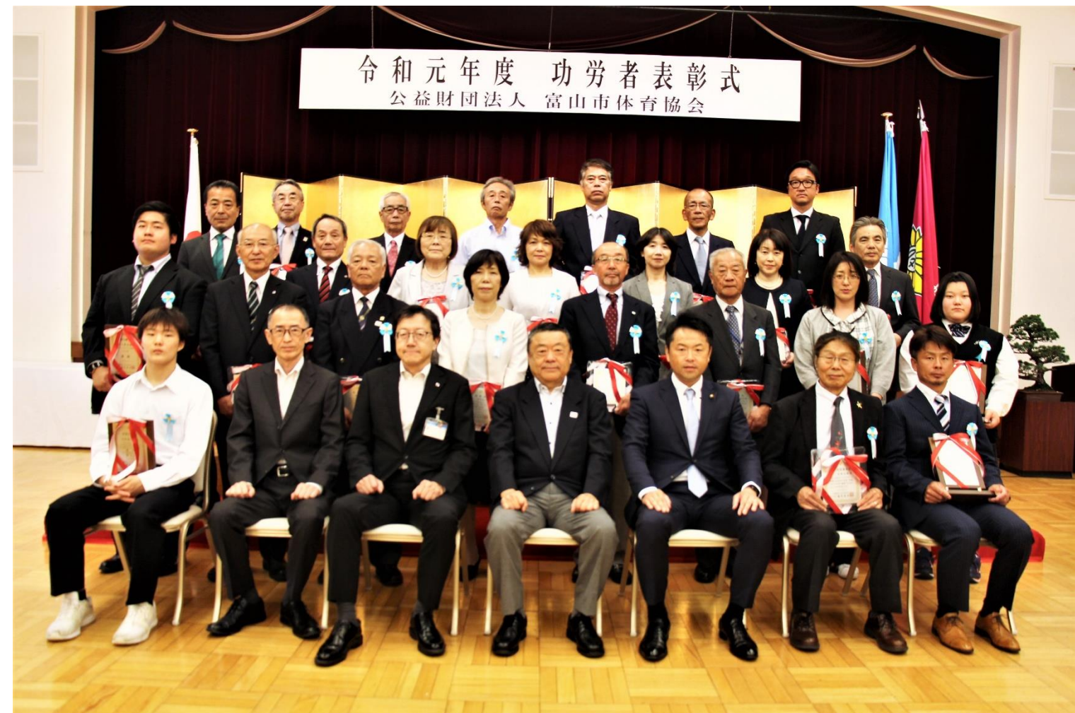
令和元年度 功労者表彰式 公益財団法人 富山県市体育協会