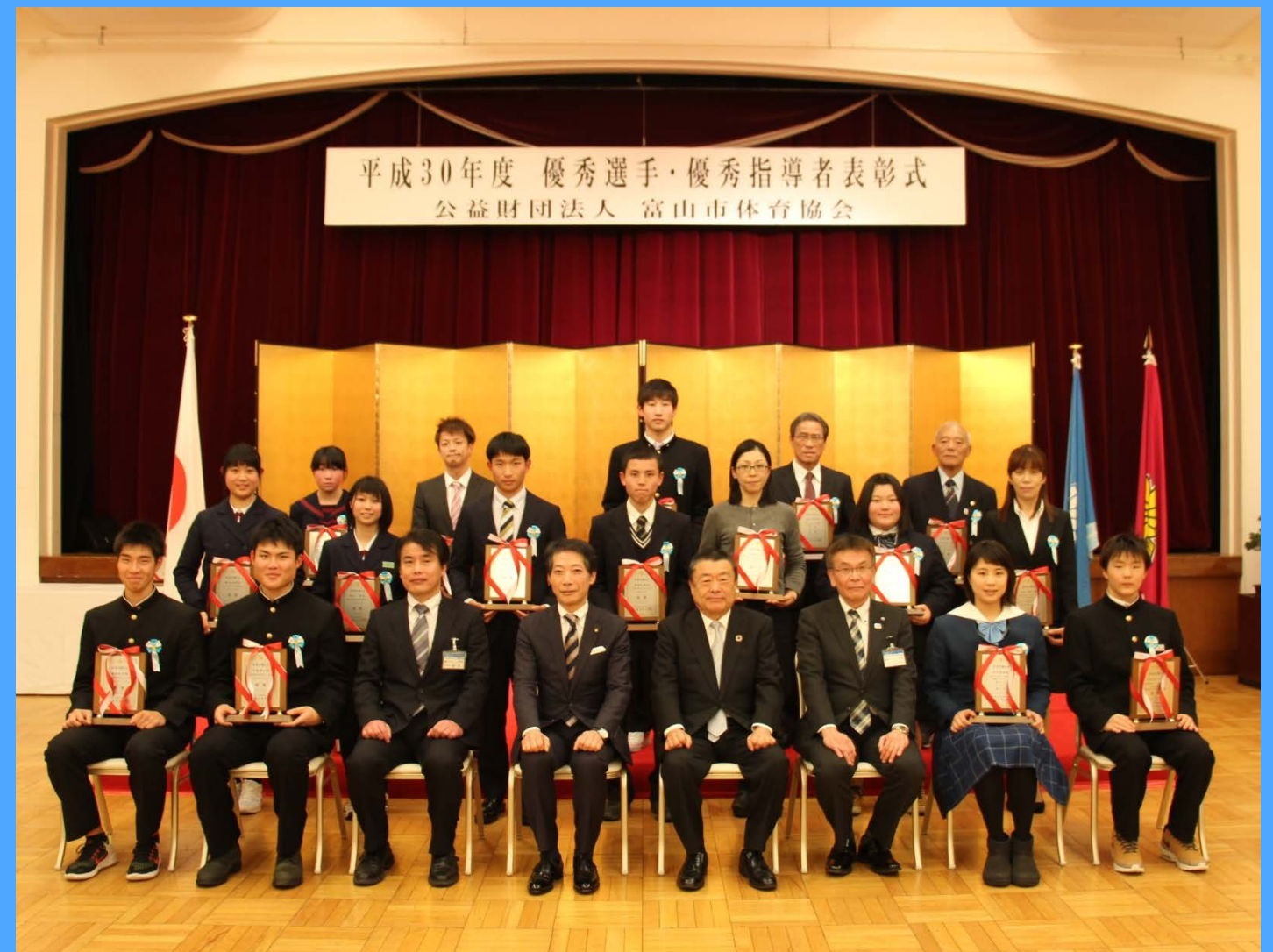
平成30年度 優秀選手及び優秀指導者表彰式