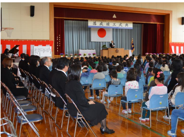
平成27年3月21日 東部小学校大規模改築竣工式 次年度の課題